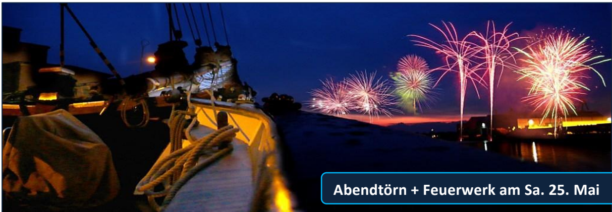
Abendtörn + Feuerwerk am Sa. 25. Mai

An der Seebäderkaje legen wir um 18 Uhr ab zu diesem mehrstündigen Wesertörn. Mit Kurs auf die offene Nordsee fahren wir zunächst an der Stromkaje entlang. Mit einer beeindruckenden Länge von 4.930 Metern gilt sie als das größte zusammenhängende Container-Terminal weltweit. In einer langen Reihe stehen hier die charakteristischen Containerbrücken dicht an dicht am Ufer und lassen uns beim eiligen Be- und Entladen der größten Frachtschiffe zuschauen. Unterwegs verwöhnt unsere exzellente Bordküche Sie mit einem reichhaltigen Abendessen.